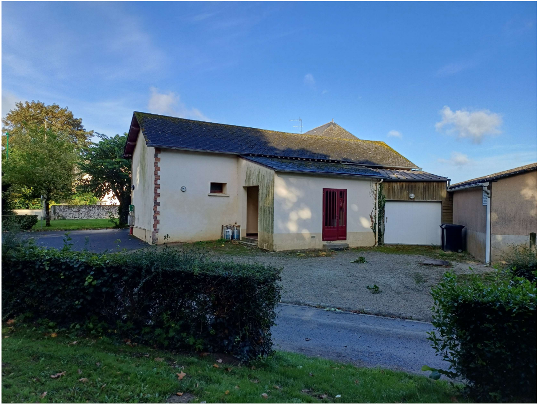
PCMI 7 - Photo proche