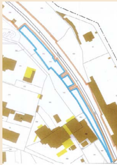
Plan de la parcelle AW 334