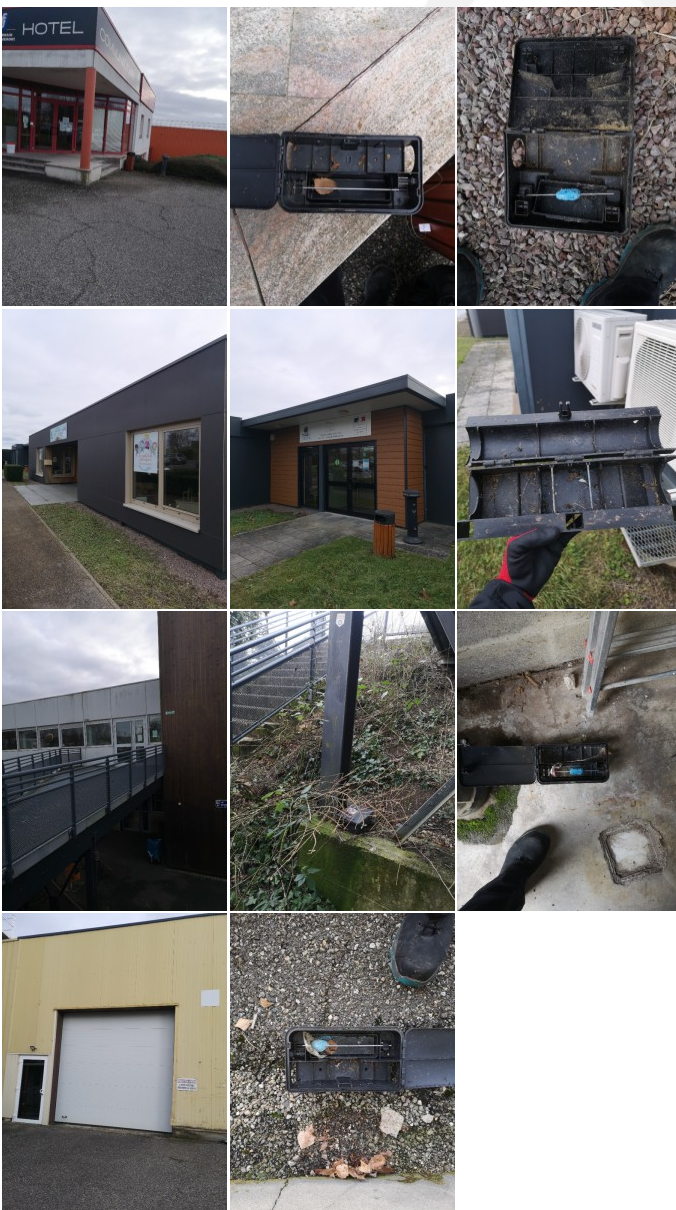
Photo voie de pénétration / indices de l'infestation