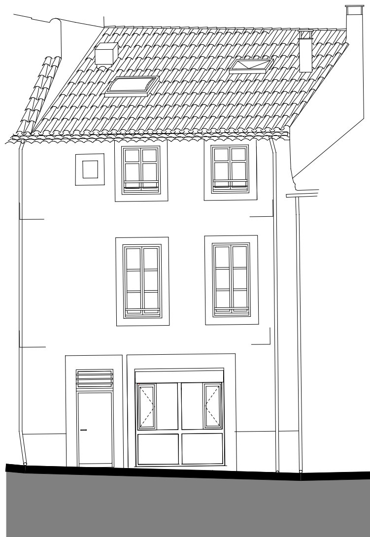
FACADE RUE DU FER A CHEVAL