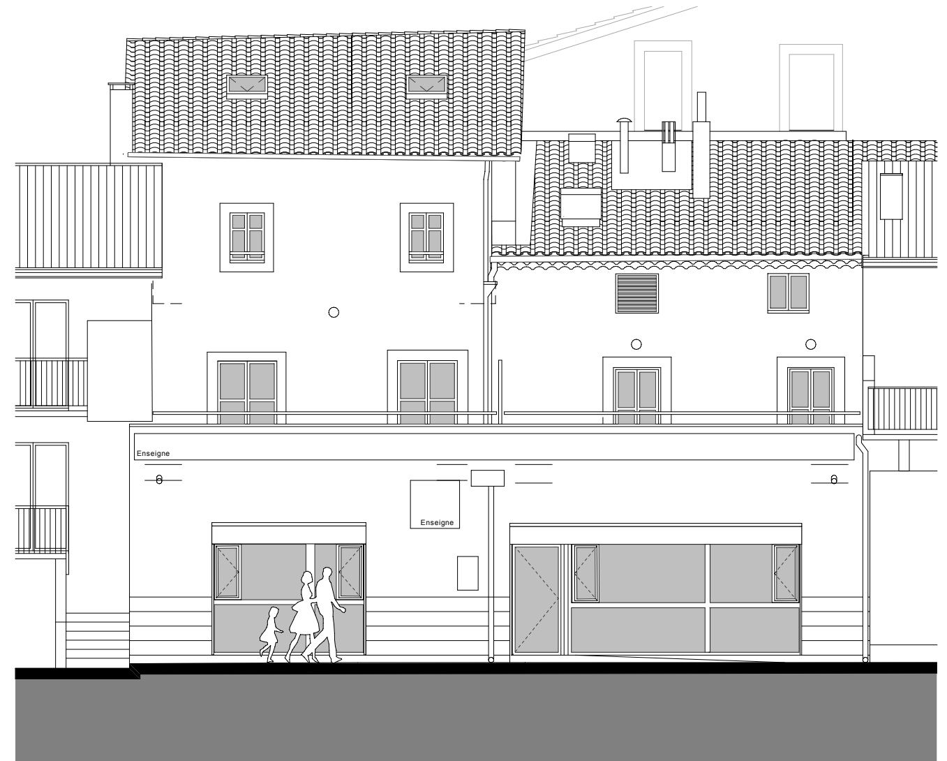
FACADE Boulevard Alfred Rogier