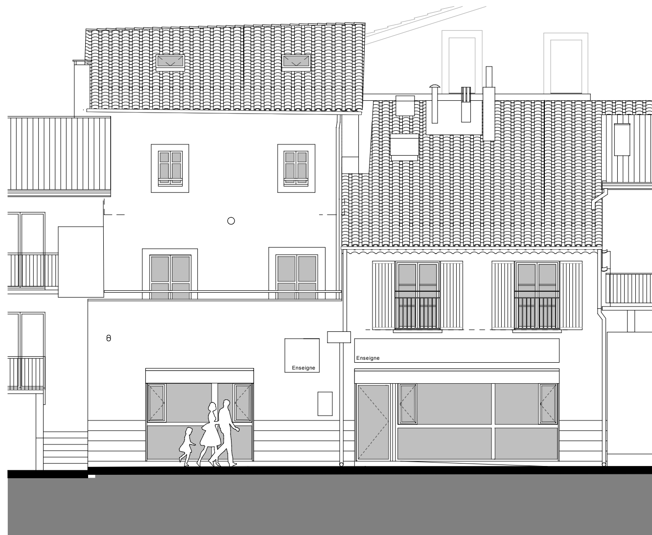
FACADE Boulevard Alfred Rogier