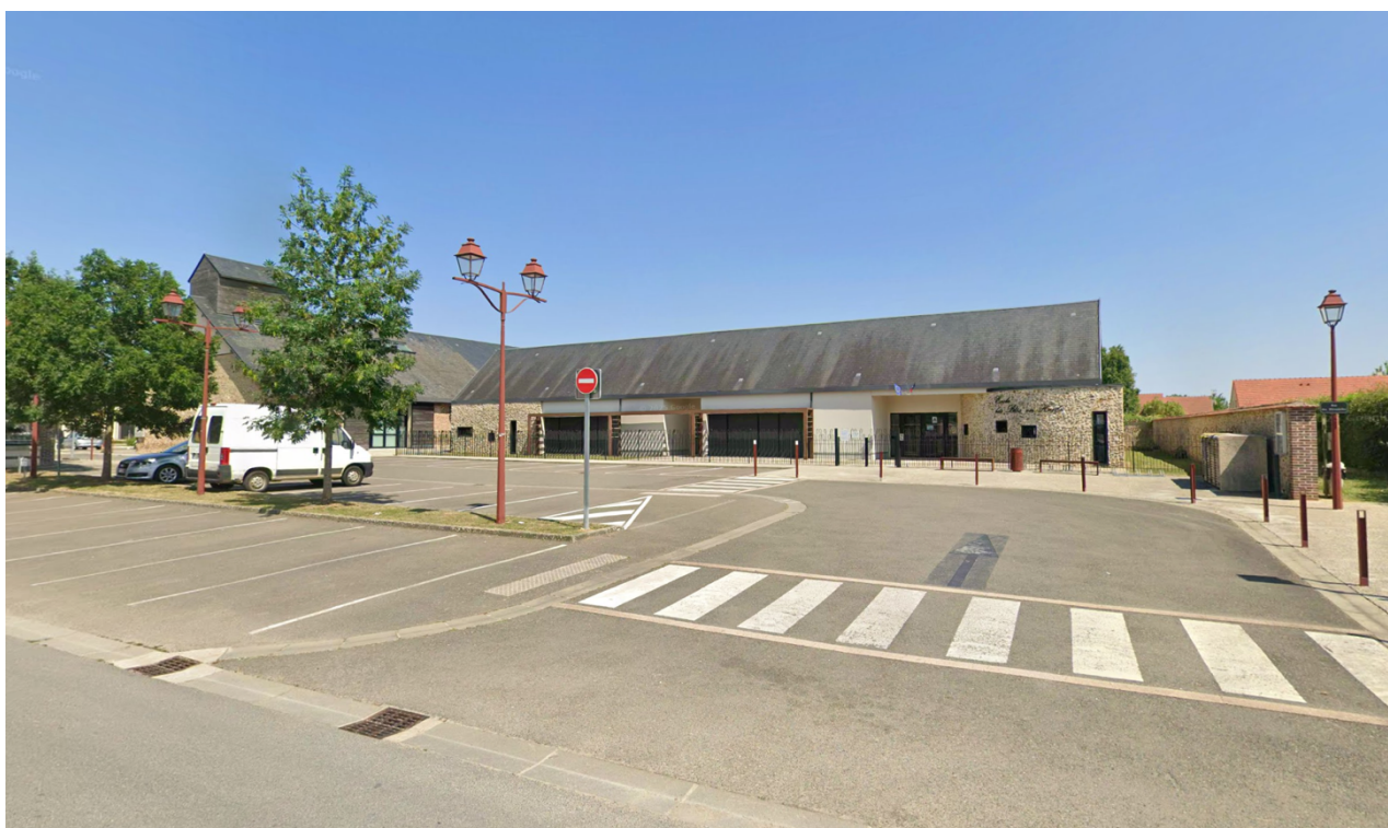
Zone du projet (vue de l'école depuis la rue de la Chapelle)