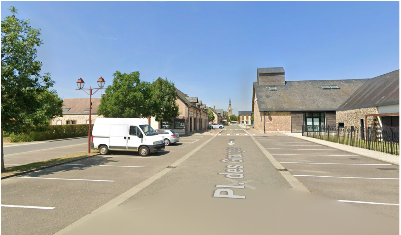
Zone du projet (vue de l'école depuis la rue des Hirondelles vers la mairie)