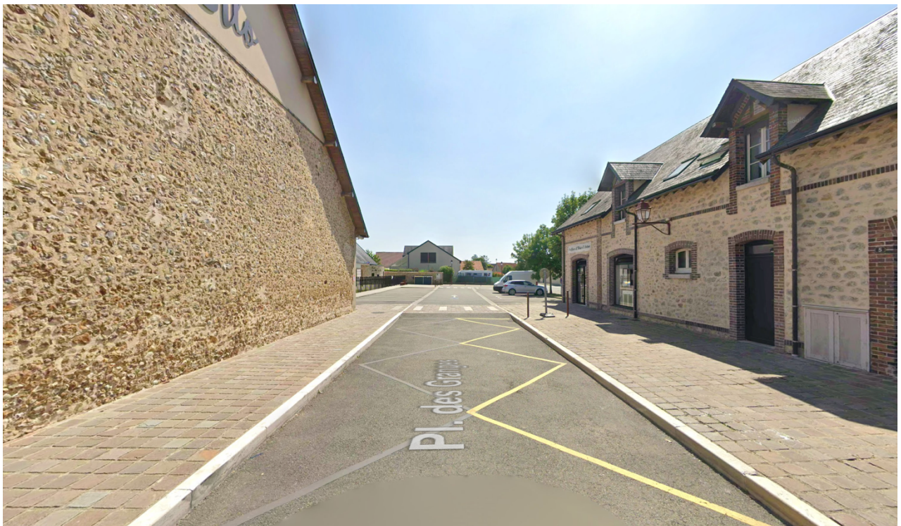
Vue vers la zone de projet depuis la place des Granges