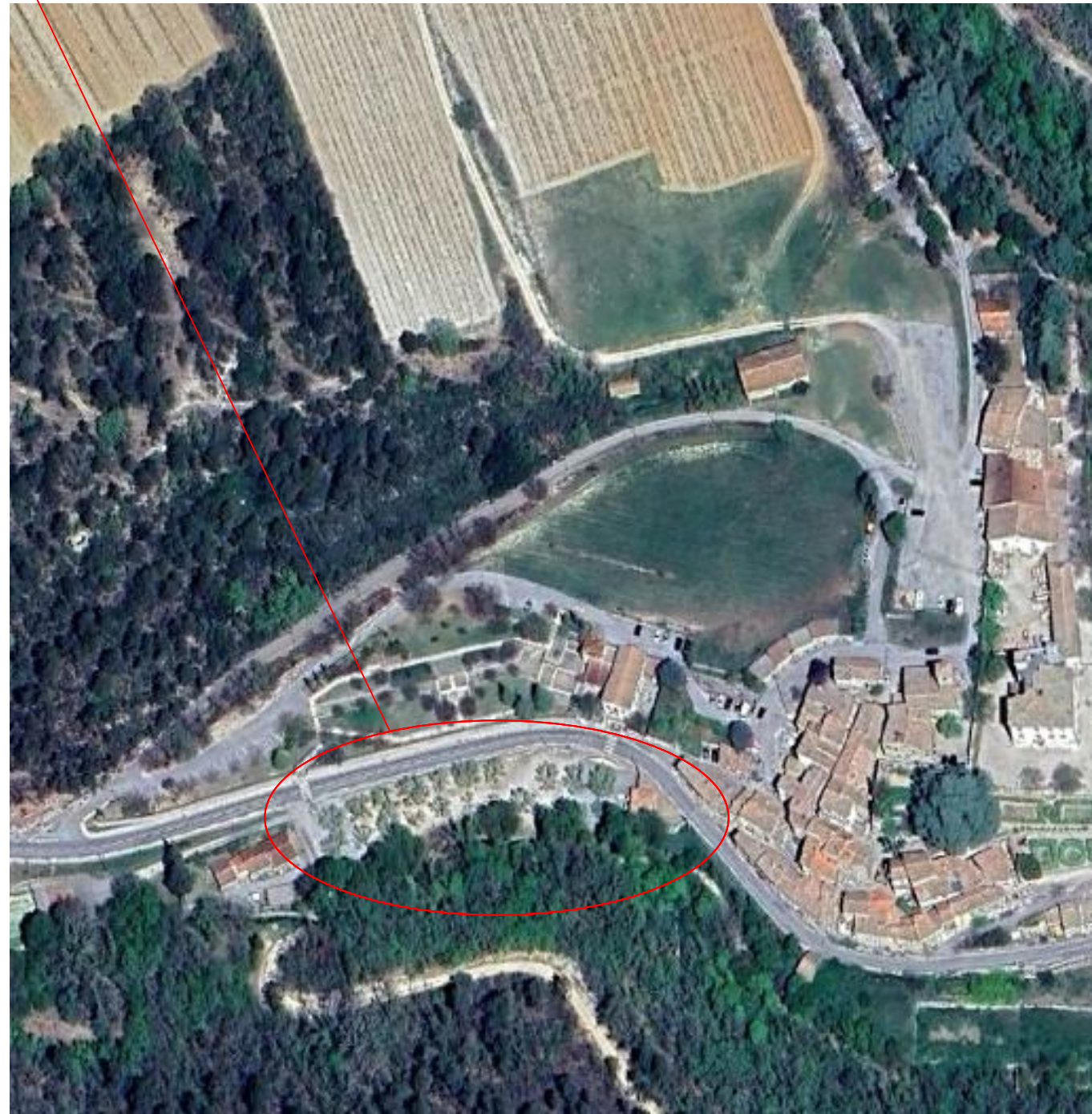
PLAN DE SITUATION 1:2500